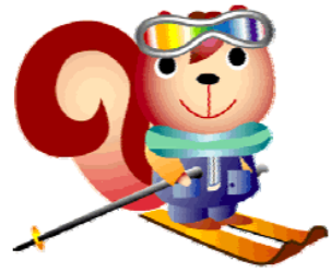
オグナほたかマスコット 「オグちゃん」

最高の雪質と変化のある斜面、オグナ穂高スキー場は楽しさ一杯！！ スキーの後は、旅館みやまで天然温泉につかり酒を飲むのもよし！！